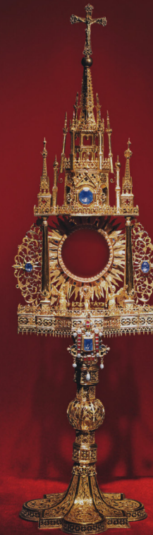
Ma aut dolo quatestius vendae elestrum ides nisto